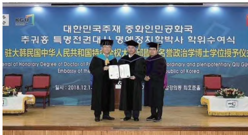
京畿大学授予中国驻韩国大使邱国洪政治学博士学位