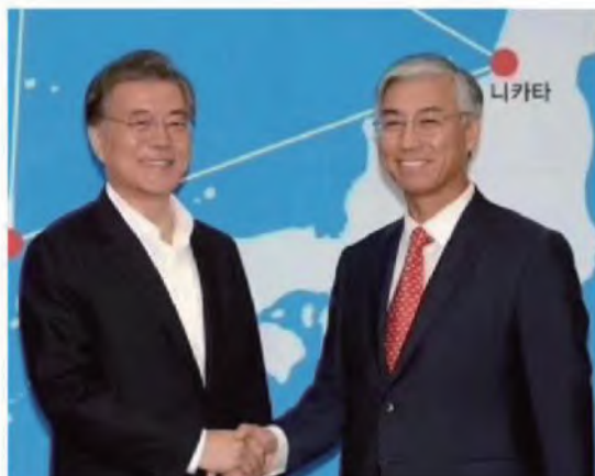
韩国总统会见中国驻韩国大使